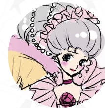
illustration by naokuro